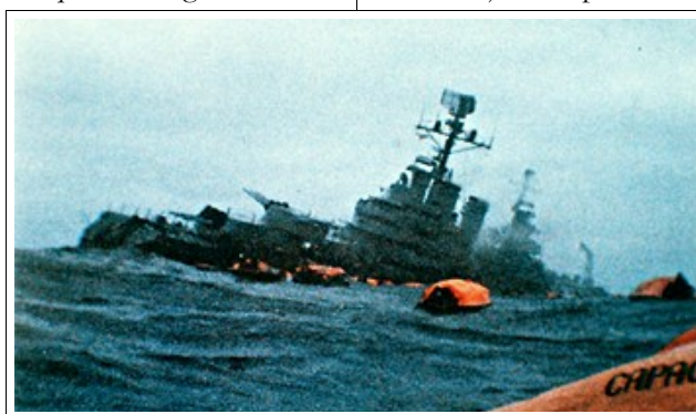
Hundimiento del buque Gral. Belgrano, luego de ser torpedeado por un submarino británico durante la guerra de las Malvinas el 2 de Mayo 1982, día en el que perdieron la vida 323 soldados argentinos que transportaba esa nave.

En estas circunstancias es que los argentinos de-